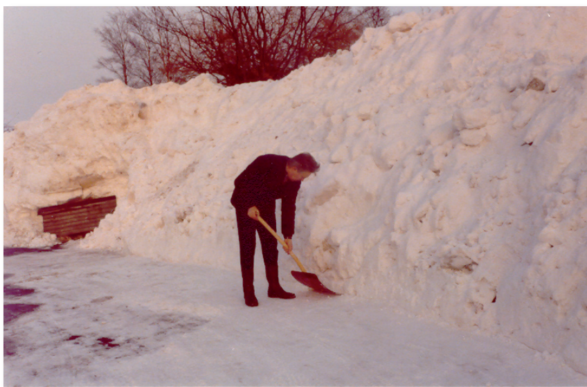
Att hålla rent utanför den egna tomten gällde också snö. Här skottar författaren under den snörika vintern år 1978/79.

Asfaltering håller ju inte hur länge som helst utan 1989 behöver man lägga på en ny toppbeläggning. Detta utföres av ABV till en kostnad av 565 175 kr. En extra utdebitering sker med 6 kr per 1000 kr:s taxeringsvärde. Kommunens bidrag utgör 43 258 kr. Samtidigt har infarten ändrats så att rörstaketet med nät och rosor tagits bort och ersatts med en refug. Gatorna är nu i så gott skick att kommunen visar dessa för besökande kommuner. Kostnaden per tomt blev dyr, därför tages beslutet att höja avgiften för att lägga upp en fond för kommande asfalteringsarbeten. På så sätt är man med och betalar när man sliter på gatorna.