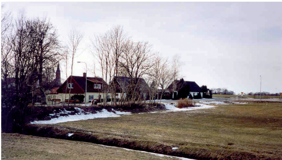
Utmed gamla vägen ligger tre hus. I det högra huset på bilden fanns ett café och huset därefter en krog.

Bilden nedan visar tre hus, som låg vid den gamla sträckningen av landsvägen, som då gick där cykelbanan nu ligger. Vägverket rätade ut vägen mellan Olle Nilssons Maskinstation och Möllevångens Plåt. I det vita huset till höger på bilden fanns ett café och utgjorde en lämplig rastplats på cykelturen från Malmö till badet i Höllviken. Fiket lades ner 1954 för att bli privatbostad.