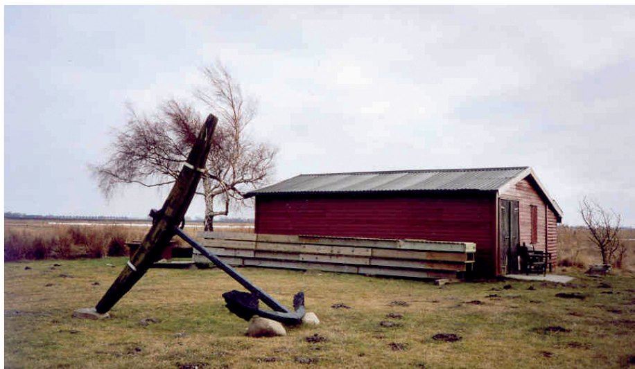
Vid stranden ligger båthuset och det skänkta ankaret. Bryggan är upptagen och vinterförvarad.

När det gällde vår strandmark var ju önskan att utnyttja denna för bad och rekreation, men detta låter sig inte göras. Det är nämligen alldeles för långgrundt och ska man tro dem som provat att gå ut till midjedjupt vatten så får man gå 1 km. Däremot visar det sig att intresset för fiske är stort. Många skaffar sig båtar, som man ankrar upp en bit från stranden vid nedslagna rörpollare. Bryggan står klar 1962 samtidigt är båthuset på plats. Här förvaras de flesta båtarna under vinterhalvåret. Kommunen skänker ett ankare, som sattes upp intill båthuset. Ankaret invigdes med en välbesökt grillafton. Vintrarna går hårt åt bryggan och många gånger har den reparerats. Numera tas den upp varje höst.