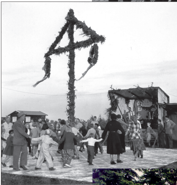
Ovan. Alla, såväl unga som gamla, var utklädda när de gick i tåget. Här syns en del på dansbanan.