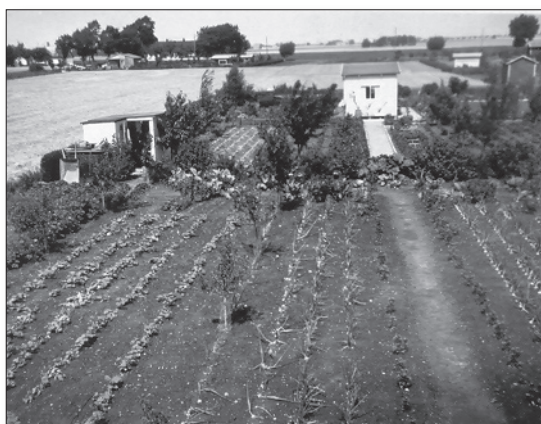
Närmast Syrengången 9 med odling av lök. Tomten bakom med stugan är Jasingången 10. Året var 1954 och Danielsson odlar säd på allmänningen och även på den så kallade offentliga marken.