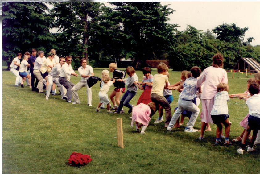
Nedan. Till lekarna hörde också dragkamp. Här är det pappor mot resten.