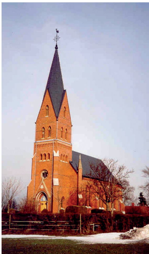
Den nya kyrkan är placerad vid väg 529 och syns från villastaden.

I december 1883 beslöts, att ny kyrka skulle byggas, och att den gamla skulle rivas. Auktion på gammalt virke från kyrkan ägde rum i början på år 1887. Ritningar på den nya kyrkan, som kom att uppföras i nygotisk stil, antogs av kyrkostämman 1885 och byggmästare utsågs 1886. Placering av kyrkan skulle ske på den nyinköpta marken 500 m väster om den gamla kyrkan. Kyrkklockornas klang skulle kunna höras även av dem, som bodde längre västerut. Det kan nämnas att kyrkan uppfördes av tegel, som hämtats i Börringe tegelbruk. Varje dag gjordes två turer med hästdragen vagn mellan byggplatsen och tegelbruket. Det blir en sträcka på ca 11 mil varje dag. Kyrkan invigdes den 26 augusti 1888 och kom att kosta församlingen 39 338 kronor och 24 öre.