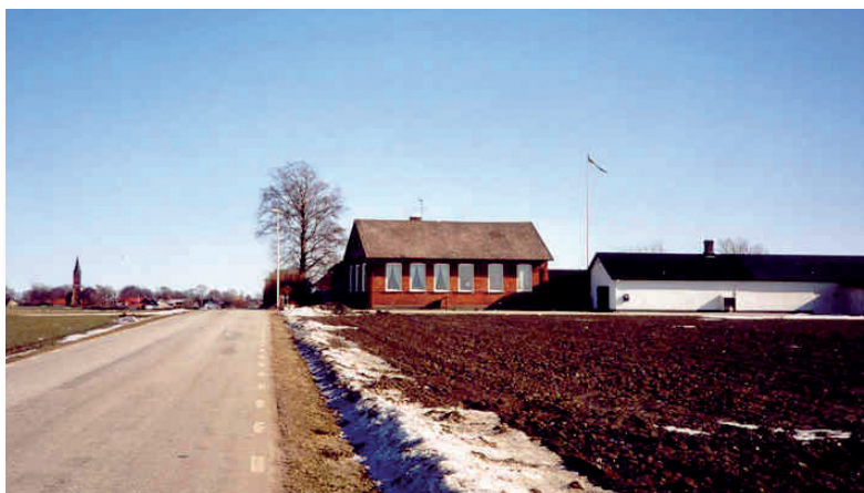
Folkskolan var inrymd i denna fastighet. I bakgrunden skymtar kyrkan.

Skolan skulle även innehålla en bostad för läraren. Det står också att läsa i protokoll, att läraren hade sin lön i natura. Han fick 4 tunnor råg och 4 tunnor korn och dessutom erhöll han både påsk- och julmat. Under sommaren fick han även tillstånd att ha ko på strandängarna. Dessutom hade han en slant för varje barn, men storleken på denna nämns inget om. Skolan är i bruk till 1899 för ersättas av den nya Folkskolan, som vi ser på nedanstående bild.