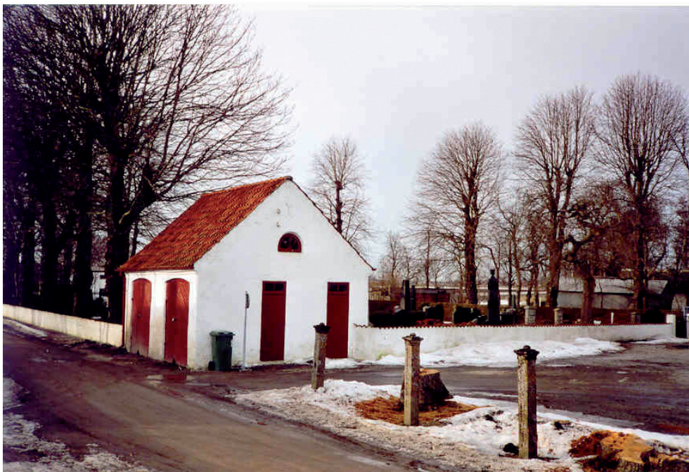
Det gamla redskapsskjulet ligger där än idag.

skjulet, kyrkogården och dess mur. I skjulet förvarades även likvagnen. För lokalisering se på den nytagna bilden nedan.