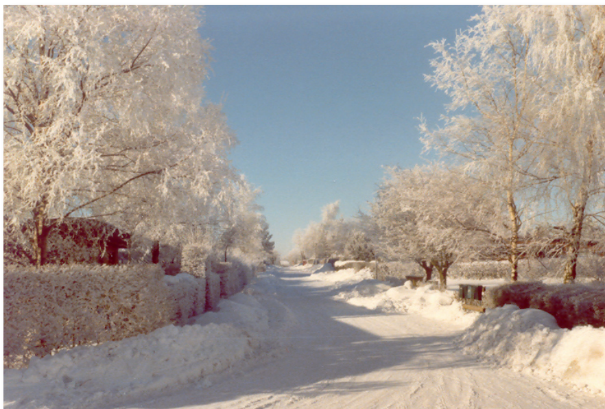
En vacker vinterdag på Ringvägen.

dagvattenbrunnar utan här gäller att vattnet ska rinna in över tomt. Det påpekas vid flera tillfällen att murar eller annat som hindrar avrinningen ej får sättas upp. Grannen får ju då ta hand om det vatten som du rätteligen skulle tagit hand om.