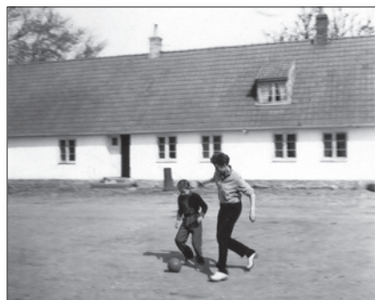
Det var även tid till lite bollspel på den grusade stora gårdsplanen.