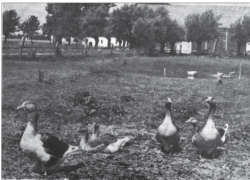
De feta, go'a gässen på den gamla, nu rivna gården i Gessie.

Kostnaden för banan kom att överstiga budgeten med 9 000 kr och slutsumman hamnade på 29 000 kr. Här utkämpades varje år Gessiemästerskapet i minigolf. För det mesta var det medlemmar och deras gäster som tog sig en match. Klubbor och bollar fick vi hålla oss själva med. Numera är ju banan borttagen då intresset blev mindre och mindre och allt fler gick över till spel med större klubbor. Hur marken såg ut innan banans anläggande syn på nedanstående foto.