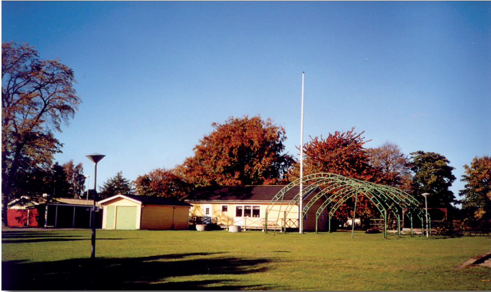
På bilden syns Allaktivitetshuset, stommen för tältduken, garage, busskur och återvinningsstation.

I begynnelsen fanns endast en förening, Föreningen Gessie Villastad u.p.a., men 1976 kommer lantmäteriet med bestämmelsen om att områden av vår typ ska ha en vägförening. En sådan bildas därför 1977. Denna tar då över all skötsel av gator och grönområden såväl som vägen ner till båthuset. Det var obligatoriskt att vara med i Vägföreningen medan det var frivilligt i Villaföreningen.