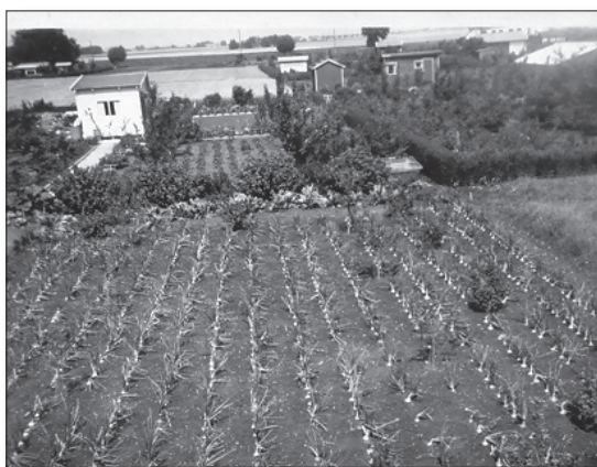
Här var det lök som var favoriten.

Den byggnadsplan som gällde fastställdes 25 mars 1948 och i denna fanns en stor yta upptagen för offentligt ändamål. Det område som vi idag kallar Allmänningen eller Grönområdet, men som då sträckte sig i norr ända upp till Ringvägen. När man gjorde upp byggplanerna hade man på fullt allvar diskussioner om behovet av mark för service som t ex skola, post och affärer. Det diskuterades också om byggande av någon form för kyrklig verksamhet. Då service av denna typ knappast kommer till stånd börjar man först nu att söka lagfart för ”affärstomterna” d.v.s de 6 tomter som ligger på Storgatan mellan Tulpan – och Piongatorna. Dessa var avsedda för affärer, därav den breddning som gjorts på Storgatan för parkering av bilar såväl som hästfordon. Samtidigt söker man lagfart för de åtta tomterna i norra delen av Allmänningen dvs tomterna Ringvägen 2- 8 samt Jasingången 11- 17, som var avsedda för skola, post mm. Föreningen lägger nu in om förvärvstillstånd och lagfart för ovanstående och dessutom för den odlade marken runt gården samt ängsmarken och enskilt vatten.