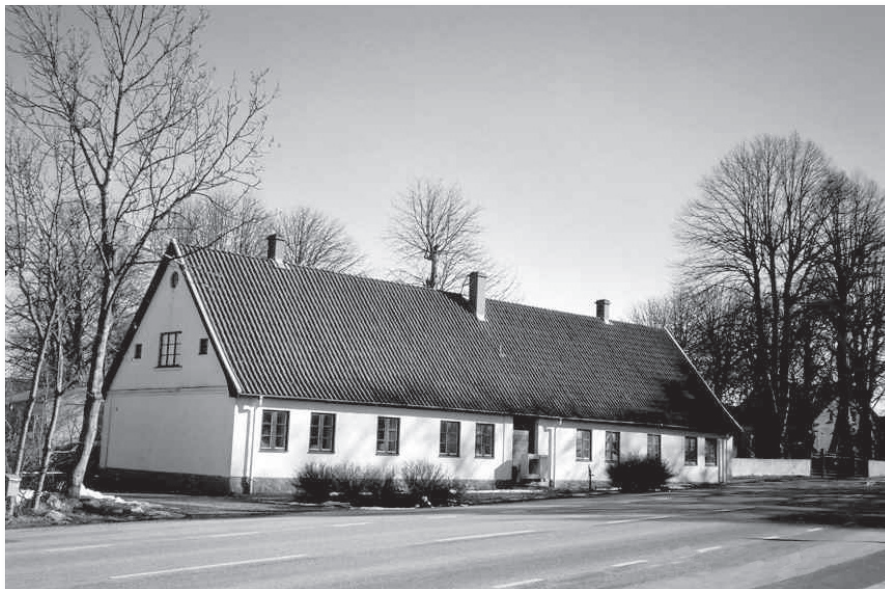
Innan detta hus blev privatbostad var det dels skola och dels fattigstuga.

Bilden nedan visar en byggnad, som säkert alla Gessiebor har lagt märke till. Flertalet vet säkert inte vad den använts till innan den blev restaurerad. Det var den gamla skolan och självfallet låg den också mitt i byn. Storskolan, som det hette på den tiden, började att byggas året efter folkskolestadgans tillkomst 1842. Huset skulle även innehålla fattighus. Ena delen var således för skolbarnen och andra de fattiga.