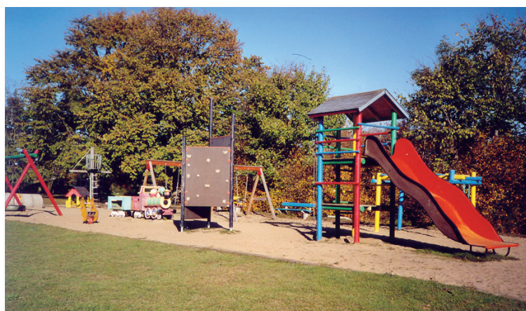
Lekplatsen har ett stort utbud av allehanda redskap.

För barnen är vårt grönområde ett eldorado med stora gräsytor och en stor lekplats med ett stort antal lekredskap. För det mesta har vi betalat allt själva, men då och då har kommunen gett oss bidrag till lekredskapen.