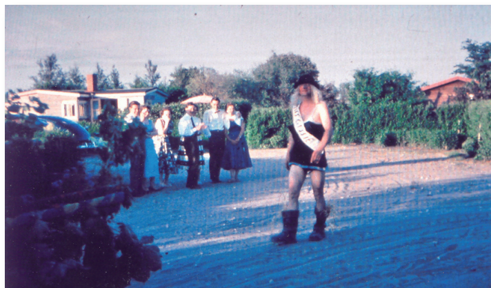
I midsommartåget 1956 vandrade Miss Gessie på den grusade Ringvägen.

Från början tog man sig fram på åkermarken. Två bilspår i marken utgjorde gatorna. Vi som hade turen att få tomter gränsande till ”stora vägen” hade det lite bättre för vi ordnade med egen ingång härifrån. Givetvis var denna typ av ”gator” ohållbart i ett längre perspektiv och därför påbörjades iordningställandet av gatorna i december 1954 för att avslutas under första halvåret 1955.