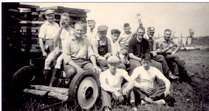
Att sprida ut grus är styvt så en läsk smakar bra för arbetslaget, som består av:

Man schaktade bort matjorden och lade ett bärlager av slamsten, som gratis kunde hämtas i Kalkbrottet i Limhamn. Med facit i hand var väl detta inte det bästa materialet för ändamålet, då man normalt använder makadam. Slamsten vittrar lätt sönder därför att den innehåller kalk. På detta lades sedan ett gruslager, som varje år skulle hyvlas och håligheter fyllas igen. Det senare arbetet utfördes av medlemmarna själva. Jag minns hur vi, beväpnade med skyffel, gick efter lastbilen och fyllde i hålen. På bilden nedan ses ett arbetslag som just tagit en paus från detta arbete. Enligt styrelsebeslut fick man en läsk som betalning. Vissa år kunde 100 ton grus läggas ut.