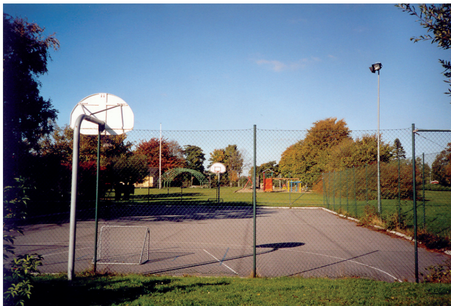
På tennisbanan kan även spelas basketboll och landhockey.

Om vågorna gick höga när det gällde Allaktivitetshuset så var det rena tsunamin när det gällde anläggande av tennisbana. Det var två fallanger som stred mot varandra och förutom tennisbanan gällde det även skötseln av området. Opinionsen kände sig hotad av styrelsen och skickade brev till medlemmarna samtidigt som man begärde extra årsmöte. Grova beskyllningar haglade i luften, men till slut låg tennisbanan där.